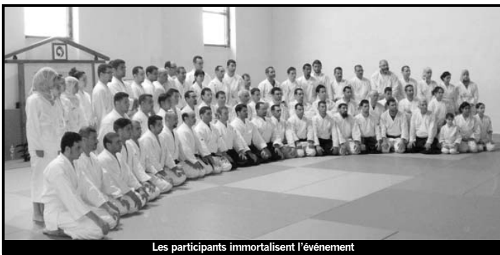
Les participants immortalisent l'événement

Beaucoup de filles pratiquent cette discipline ; recherche d'une spiritualité et/ou acquisition d'un moyen de défense ? Une anecdote qui montre la nouvelle approche dans les rela-